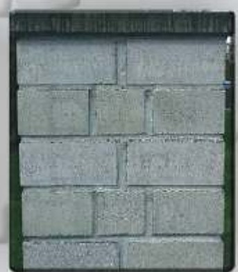
Behandelt mit POWERnANO Schutz